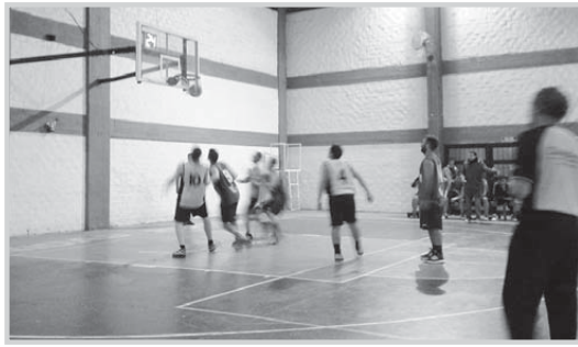
El primer cuarto por 20 a 12. En el inicio del segundo