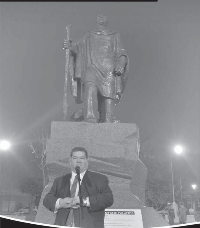
NIFACIO PALACIOS Escultura en la Plaza Almafuerde