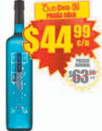
Vino Espumante Blue FRIZZE EVOLUTION x 750 ml. Precio x lt.: $ 59.98 / Stock: 60.000 uds.