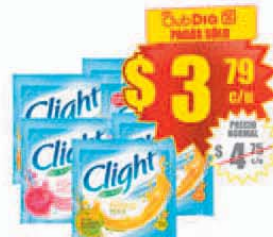
Jugo en Polvo Light Varios Sabores CLIGHT x 8 g. Precio x kg.: $ 473.75 Stock: 225.000 uds.