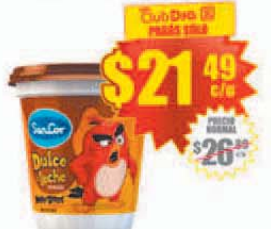
Dulce de Leche Clásico SANCOR x 400 g. Precio x kg.: $ 53.72 / Stock: 320.000 uds.