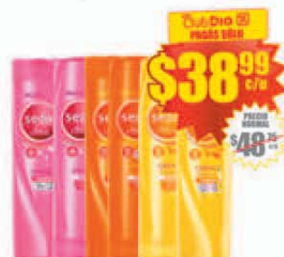
Shampoo/Acondicionador Varias Fragancias SEDAL x 340 ml. Precio x lt.: $ 114.67 / Stock: 40.000 uds.