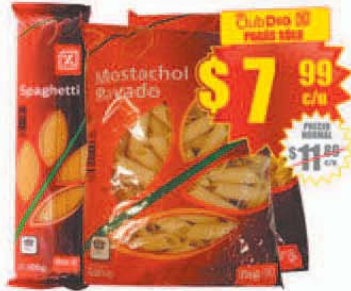
Mostachol/Tirabuzón/Spaghetti Día x 500 g. Precio x kg.: $ 15.98 / Stock: 1.600.000 uds.