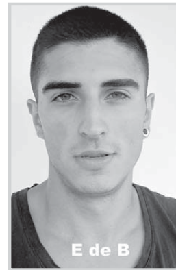
E de B