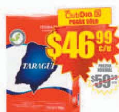
Yerba Mate TARAGÜI x 1 kg. Stock: 230.000 uds.