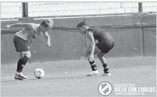
CLUB ATLÉTICO VILLA SAN CARLOS WWW.VILLASANCARLOS.CLUB