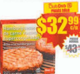
Hamburguesas Supercongeladas Día x 4 uds. (320/332 g.) Precio x kg.: $ 103.09/$ 99.36 Stock: 220.000 uds.