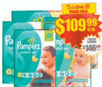
Pañal Confort Sec P/M/G/XG/XXG PAMPERS x 30/26/22/18/18 uds. Precio x ud.: $ 3.66/$4.23/$4.99/$6.11/ $6.11 / Stock: 22.000 uds.