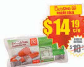
Salchichas Día x 6 uds. (225 g.) Precio x kg.: $ 63.06 / Stock: 750.000 uds.