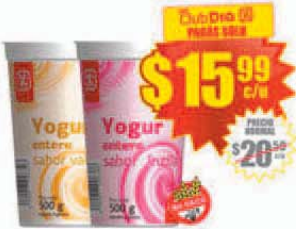
Yogur Firme Entero Vainilla/Frutilla Día x 500 g. Precio x kg.: $ 31.98 / Stock: 220.000 uds.