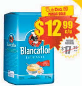
Harina Leudante BLANCAFLOR x 1 kg. Stock: 100.000 uds.