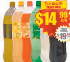
Gaseosa Varios Sabores Día x 2.25 lts. Precio x lt.: $ 6.66 / Stock: 140.000 uds.