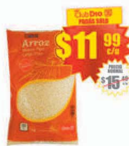
Arroz Largo Fino 00000 Día x 1 kg. Stock: 800.000 uds.