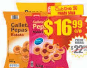
Galletitas Pepas /Batata/ Frutos del Bosque Día x 500 g. Precio x kg.: $ 33.98 / Stock: 380.000 uds.