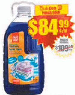
Jabón Líquido para Ropa Día x 3 lts. Precio x lt.: $ 28.33 / Stock: 110.000 uds.