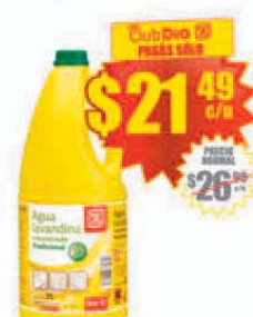
Lavandina Concentrada Día x 2 lts. Precio x lt.: $ 10.74 / Stock: 150.000 uds.