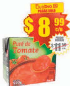
Puré de Tomate Día x 520 g. Precio x kg.: $ 17.28 / Stock: 1.300.000 uds.