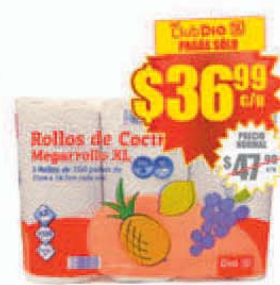
Rollo de Cocina Día x 3 uds. (100 paños c/u.) Precio x m²: $ 3.14 / Stock: 400.000 uds.