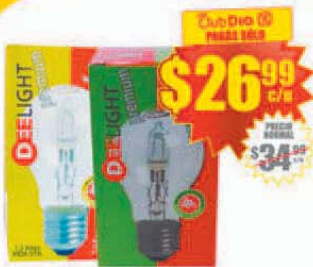
Lámpara Halógena 70/52 W DEELIGHT x 1 ud. Stock: 55.000 uds.

20 OFERTAS INCREÍBLES VÁLIDAS DEL 1 AL 28 DE FEBRERO!