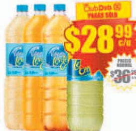
Agua Saborizada Varios Sabores LEVITE CERO x 2.25/2.5 lts. Precio x lt.: $ 12.88/$11.59 / Stock: 60.000 uds.