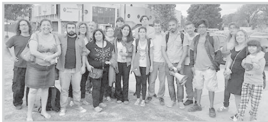
premio para los docentes que asistían a la escuela en días de paro. En jornadas de difusión que llevaron a cabo en el Centro Cívico, representantes del sector manifestaron su acuerdo con la exigencia al llamado de

Integrantes de la Lista Multicolor de SUTEBA Berisso llevaron adelante en los últimos días varias actividades para hacer conocer su posición respecto del conflicto relacionado con la irresuelta paritaria docente. Antes de convocar a una 'marcha de antorchas' a fines de la semana pasada, referentes del sector criticaron las declaraciones 'anti-estatutarias y anti-constitucionales' del gobierno provincial, así como el llamado a 'voluntarios' o el