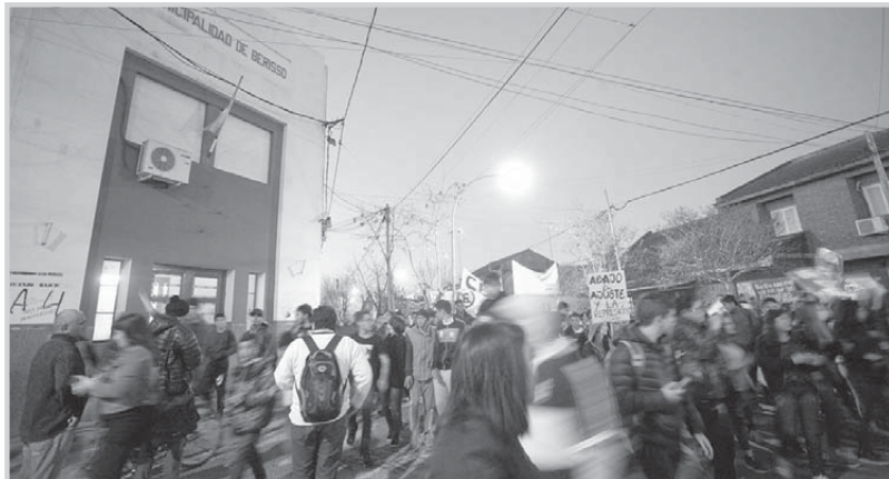
la intersección con Avenida Génova, luego de pasar frente

Con banderas, carteles y el pedido público de 'basta de represión a los estudiantes' los manifestantes dieron comienzo a su caminar en el playón Carlos Cajade del Parque Cívico, transitando Avenida Montevideo y haciendo un alto en