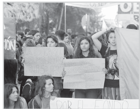
Municipio, retornaron al Parque Cívico, dando fin al reco-

rrido junto al Monumento a los Desaparecidos emplazado a uno de los laterales de la Escuela de Arte.