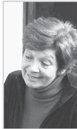
El Frente Néstor Kirchner, conformado por Primero La Patria, La Franja Sur, La Ci-

priano, el Centro Cultural El Galpón, Agrupación El barrio Solidaridad e Integración Nación Nacional -sectores referenciados con la figura de la ex-Presidente Cristina Fernández de Kirchner a nivel nacional- continúa trabajando con el objetivo de acercar posiciones para conseguir la unidad del peronismo en el distrito de cara a las elecciones legislativas.