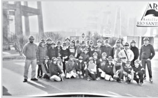
Según se adelantó, la iniciativa alcanzará a estudiantes

Esta semana se inició un ciclo de visitas escolares guiadas a diferentes sitios de interés regional, enmarcado en un acuerdo alcanzado por la Dirección municipal de Cultura y la Jefatura distrital de Educación. La primera visita fue al Astillero Río Santiago y la protagonizaron alumnos de sexto año de primaria. El programa también incluirá paseos por el Museo Puerto La Plata, Museo de YPF, Museo 1871, Museo de la Soda, Museo Ornitológico y Terraplén Costero, con el objetivo de promocionar las actividades productivas y culturales de la región.