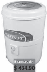
Drean Lav. mod 56RB