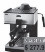
Oster Cafetera 3299