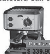
Oster Cafetera CMP55