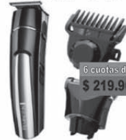
REMINGTON cortador 4110