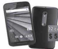
MOTOROLA Motorola G Play