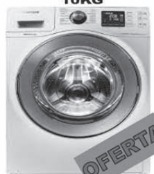
SAMSUNG Lavasecarropas 10KG