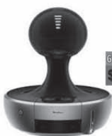
Moulinex Cafetera DROP