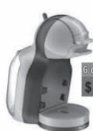
Moulinex Cafetera GENIO