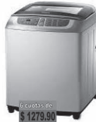
SAMSUNG Lavarropas 8KG-700RPM