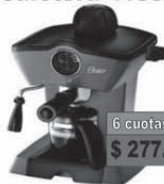
Oster Cafetera 4188