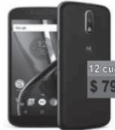
MOTOROLA Motorola G4