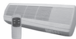
everest Caloventor split