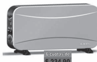
AXEL Convector c/turbo