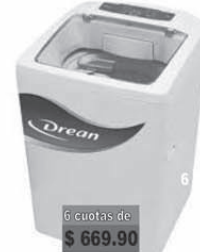
Drean Lavarropas 5KG-500RPM