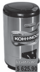
KOHL-NOOR Sec. 6.5KG Acero