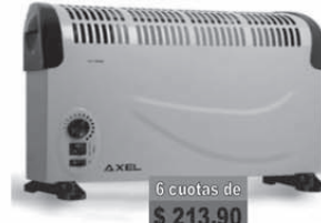
AXEL Convector c/turbo