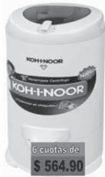
KOHL-NOOR Sec. 6.5KG Glasico