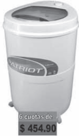
Drean Lav. mod 57RT