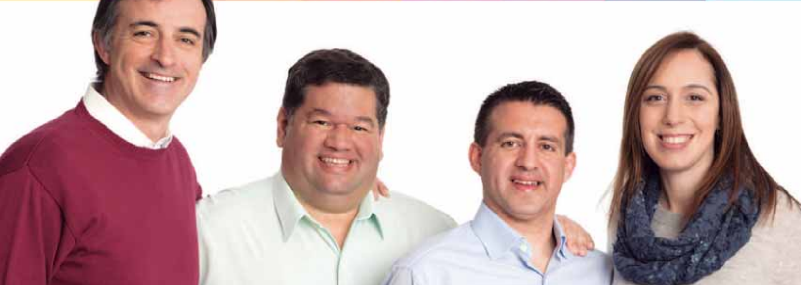
Esteban Bullrich • Senador Nacional