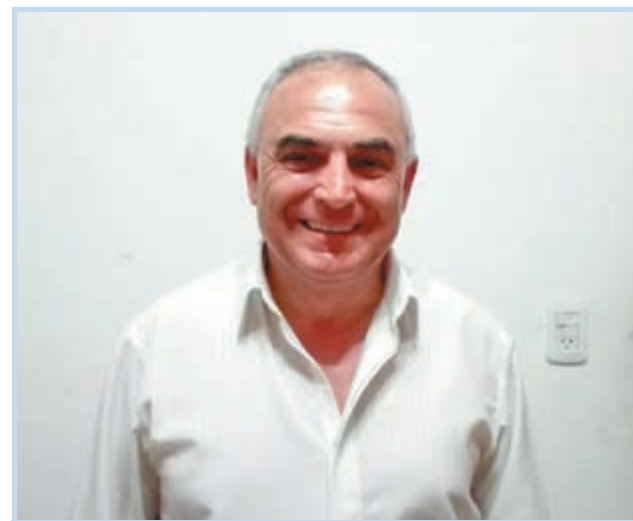
Ángel Celi (Frente 1País)