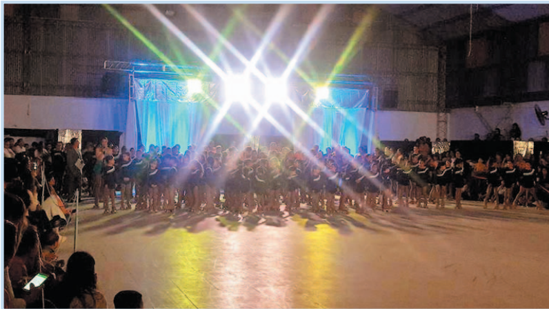
(Tarzan, el Amor de una Madre).

El evento contó con la participación de más de 130 patinadoras, ligadas a los 4 turnos que entrenan semanalmente en la sede de calle Montevideo y 25. Se destacaron las presentaciones del Grupo Mayor, Campeón Nacional en Rosario (Que Nadie Te Impida Volar) el pasado mes de agosto, y del Grupo Menor, que se consagró campeón local en noviembre