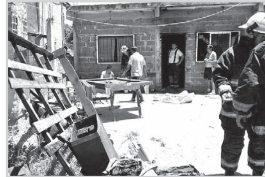
camiento El Carmen. Dos horas más tarde, la misma dotación sofocó el incendio de un árbol en 91 entre Ruta 11 y 123.

Pasada la medianoche del lunes se registraron dos hechos menores en la zona de La Franja. Hacia la una de la mañana, el incendio de un vehículo en desuso en 122 entre 78 y 79 demandó la actuación de una dotación de bomberos del destaca-