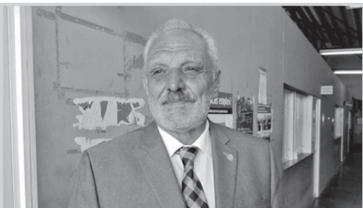
Viene de pág. 4

tuvo cargado de emotividad y datos. La mayoría de las cosas sabemos que son realidad y otras que se irán solucionando como el caso de las viviendas del barrio San José Obrero que no se mencionó, pero que son cosas que están pendientes. Vamos a acompañar todo lo que sea positivo; creo que el gobierno está en una buena senda, tiene un buen equipo y se están abriendo algunas puertas que son importantes”, subrayó.