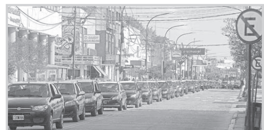
Anti UBER. Con una larga caravana, hace algunas semanas los taxistas habían reclamado que se legislara para proteger al sector.