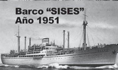
Barco “SISES” Año 1951