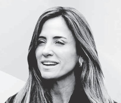
Victoria Tolosa Paz