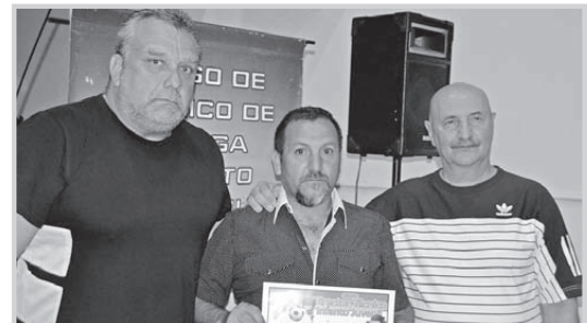
que desde su implementación, el curso otorgó diplomas a 700 directores técnicos infanto juveniles.