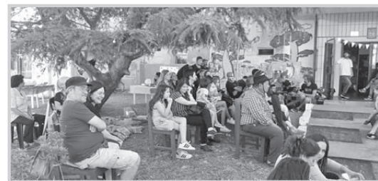
“Las ratas de siempre” y “Mons Sordos”; el Grupo de Teatro Leído Berisso coordinado