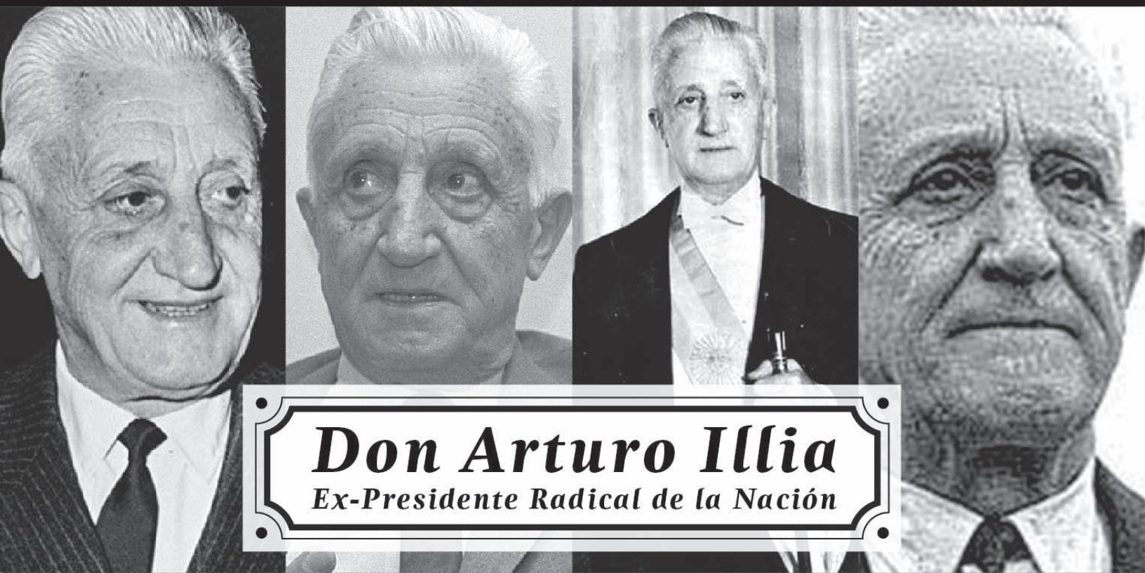
Don Arturo Illia Ex-Presidente Radical de la Nación