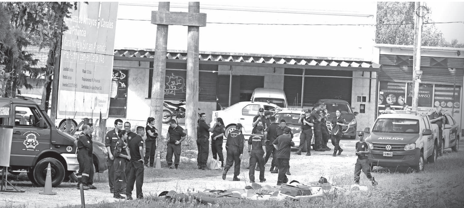
CASO GISELLA SOLÍS CALLE