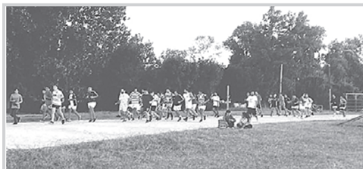
En el marco de dicha preparación ya se agendaron dos amistosos antes del mencionado cotejo ante Ensenada Rugby. El sábado 16, los de Berisso visitarán a Marcos Paz

En lo estrictamente deportivo, los planteles superior y juvenil del BRC continúan realizando tareas de pretemporada para encontrar su mejor forma física y de juego con vistas al inicio del nuevo torneo de la URBA.