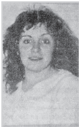
48 años. Te recordamos con amor, toda tu familia.