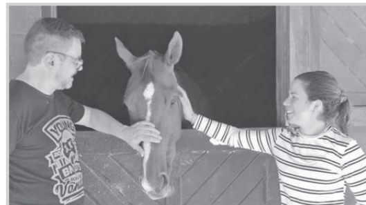
critican o discriminan no se animarían a subir.