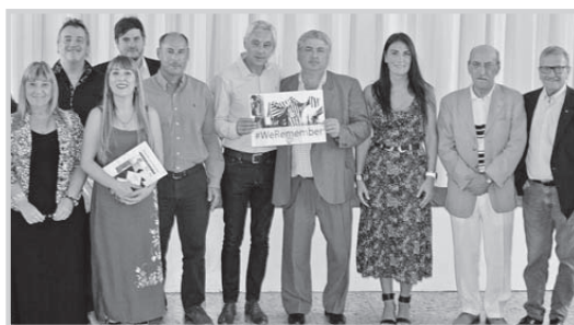
Luego de la reunión el jefe comunal calificó de "positivo el encuentro que permitió for-

Luego del encuentro formal, la delegación recorrió las instalaciones de la sede social, donde se pudieron apreciar las actividades que se llevan a cabo.