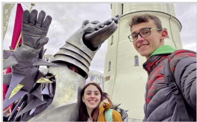
(viene de pág. 12)

Ambos dejaron un mensaje a quienes tengan posibilidades de vivir una experiencia similar. “Un consejo es que vayan con ganas y decididos, que van a poder aprender el idioma si van concentrados en hacerlo”, apuntaron.