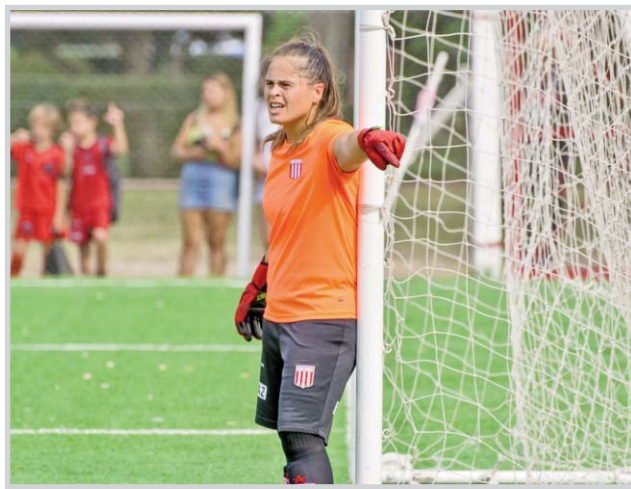
ARQUERA Y PENITENCIARIA

Su vínculo con el fútbol de manera más profesional comenzó luego de haber visto una propaganda del Centro de Entrenamiento Formativo para Arqueros (CEFARQ), en la que informaban que se comenzaría a incluir mujeres