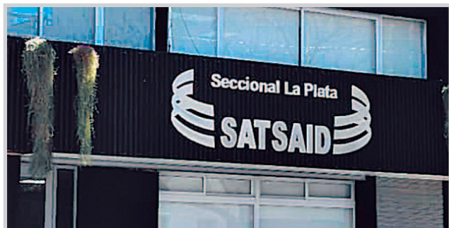
en la recepción; la construcción de nuevos baños, cocina y comedor; la remodelación del auditorio y del SUM y la

Concluyó en los últimos días la tercera y última etapa de remodelación de la sede platense del SATSAID. Entre las principales modificaciones efectuadas en el edificio de 39 entre 10 y 11 figuran la modernización de la fachada, marquesina y vereda; la refacción de las oficinas de las secretarías, Legales, Prensa y Edición; la creación de seis consultorios y una sala de profesionales médicos; la instalación de mamparas sanitarias