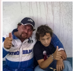
Rioplatense, en este último caso a bordo de un Ford Falcon que todavía conserva.