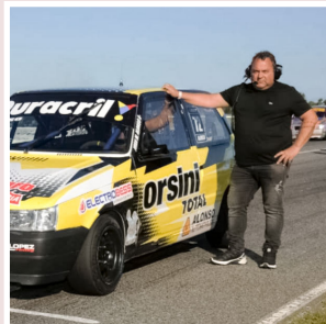
el berissense tuvo podio doble, ya que en la primera carrera terminó tercero y se adjudicó la segunda. La tercera fecha, primera de este año, está programada para el 17 de marzo.