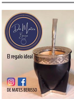
El regalo ideal