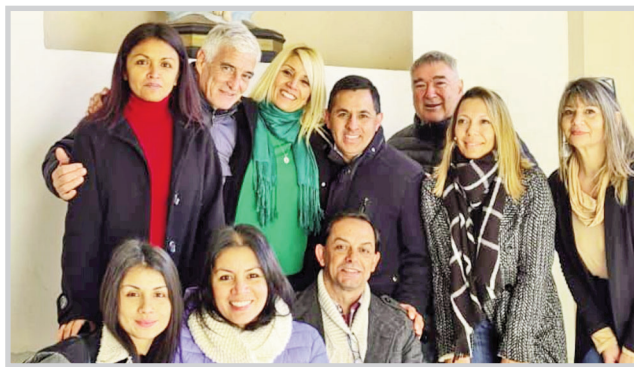
Parte de la delegación local con las hijas del 'Momo' en la parroquia de Necochea en la que se compartió una misa en homenaje.

En Necochea, quienes llegaron de diferentes puntos de la provincia fueron recibidos por