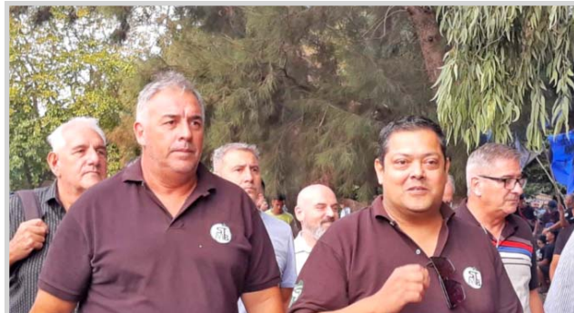
Los máximos referentes de la Lista Verde esperan revalidar mandato en las urnas