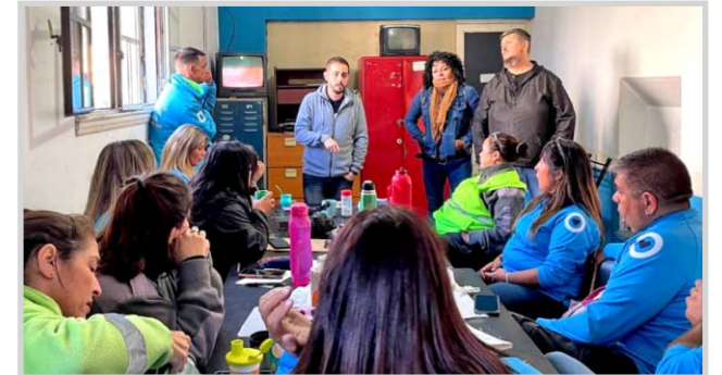
Integrantes de la Lista Naranja en actividades previas a los comicios del miércoles