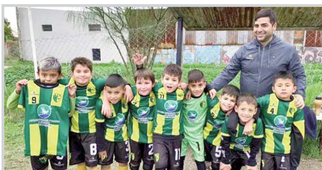
2015 Nueva Villa Argüello