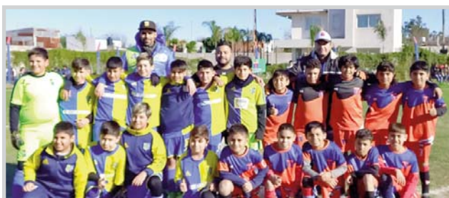
2012 Villa Zula y Canal Oeste