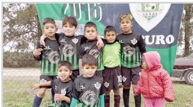
2016 Punta Lara

resultados: Pettirossi 1 – Nueva Villa Argüello A 1; La Ribera 0 – Pettirossi B 2; Santa Teresita 1 – Victoria F 0; Victoria 2 – Nueva Villa Argüello B 0; Villa Progreso 1 – Villa España Negro 0; Villa España Rojo 0 – Def. Punta Lara; 9 de Julio 0 – Cambaceres 5, con CDR Villa Argüello libre. Con dichos resultados, la tabla sigue estando comandada por Cambaceres con 18 puntos, seguido por Def. Punta Lara con 14 y Victoria con 13.