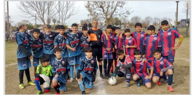
CRS y Villa Paula 2010