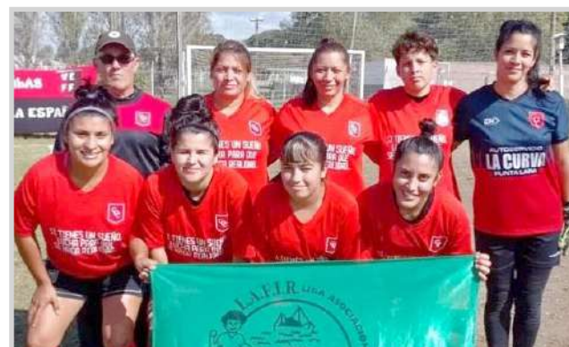
Las chicas de Cambaceres se mantienen en la punta de la tabla del torneo femenino

Por categoría, los punteros son Deportivo Gimnasta en 2010 (31 puntos); Estrella y Vi-