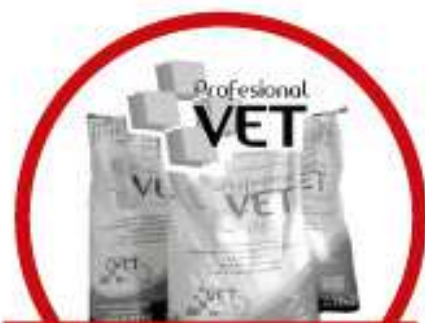
Lo nuevo en Berisso Alimento para mascotas