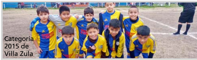
Categoría 2015 de Villa Zula

Los partidos programados para la fecha 19 (ante-penúltima), que se disputará este fin de semana son, además de Villa Zula vs. Monasterio, Pettirossi vs. Saladero; Def. Punta Lara vs. Universitario; Racing Bavio vs. Villa Paula; Punta Lara vs. Villa Albino; El Ciclón vs. Filial Lauri; Canal Oeste vs. Villa España; Estrella vs. Nueva V. Argüello; Santa Teresita vs. CDRVA y Santiagueños vs. Gimnasia.