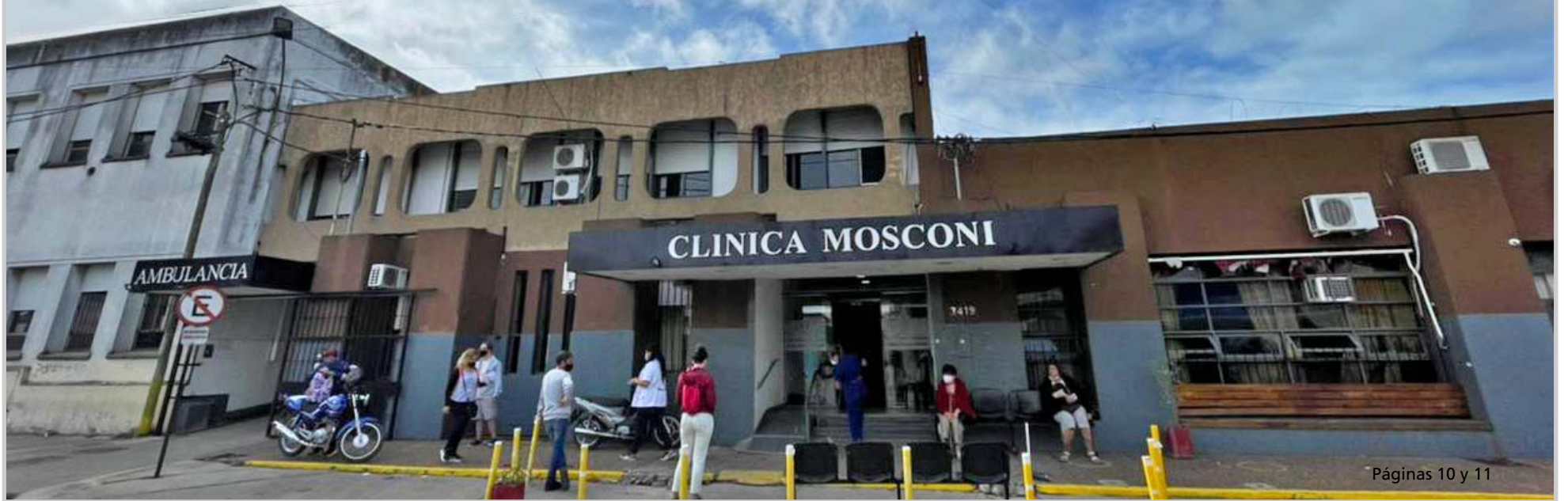
Páginas 10 y 11

Invocando graves deficiencias en la atención y cantidad insuficiente de recursos humanos y físicos, entre otras falencias, el INSSJP puso fin al contrato con el establecimiento. Internación y cirugías, las prestaciones afectadas en medio de la incertidumbre que enfrentan pacientes y trabajadores. El abogado de la cooperativa cuestiona la decisión y sospecha de potenciales 'segundas intenciones'.