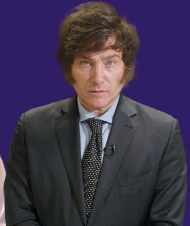
JAVIER MILEI PRESIDENTE