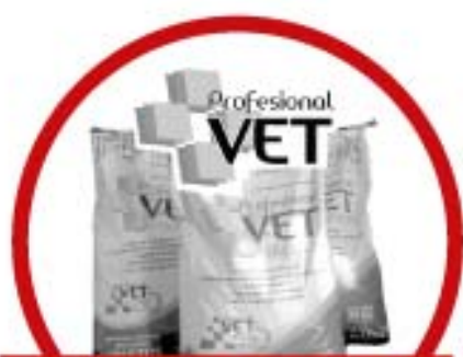
Lo nuevo en Berisso Alimento para mascotas