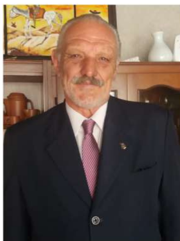
La Teo Festa 18 de noviembre

Te honro en este "Recordar", que en mi corazón es presencia de vida y AMOR POR SIEMPRE.