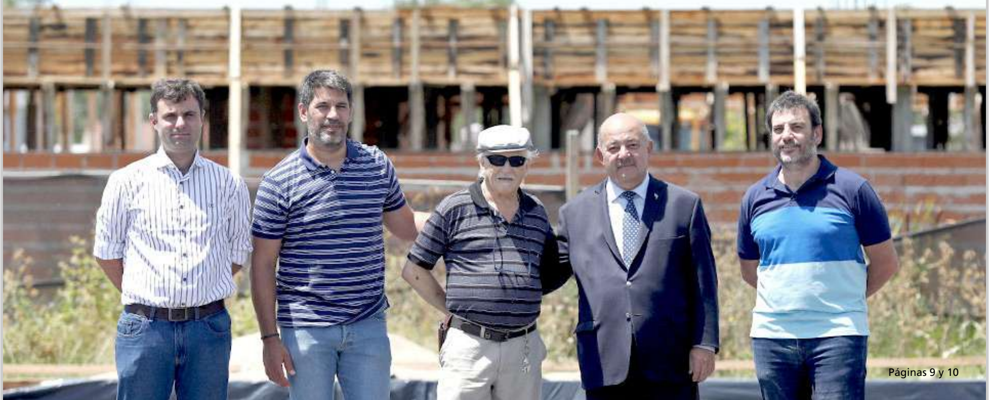
Páginas 9 y 10

Va dibujándose en inmediaciones de 129 y 64 la fisonomía de un Jardín Maternal, un Centro de Atención Primaria de la Salud y un Centro vinculado a la Economía Popular, espacios ligados al proyecto por el que cobró vida el barrio de trabajadores no docentes Ernesto "Semilla" Ramírez.