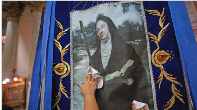
Un oficio en la Basílica de Nuestra Señora de la Merced en Buenos Aires, para celebrar esta semana la canonización de Mamá Antula

Canonizada por el Papa el pasado domingo, la religiosa santiagueña se transformó en la primera santa argentina. En 2021, su imagen había quedado plasmada en un espacio de la parroquia Santos Pedro y Pablo.