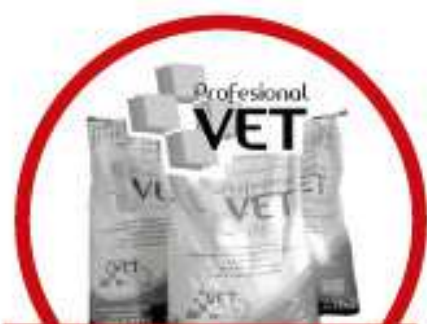
Lo nuevo en Berisso Alimento para mascotas