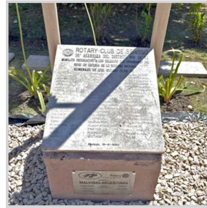
En los mástiles ya flamean la bandera argentina y del Rotary y la invitación de los direc-