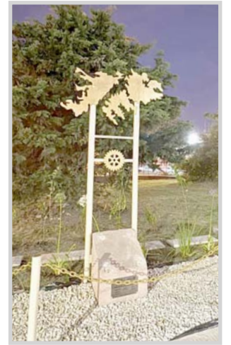
tivos del club a la comunidad es cuidar el nuevo espacio y sumarse a la causa Malvinas, de- jando junto al monumento sus mensajes, flores o cintas con los colores argentinos.