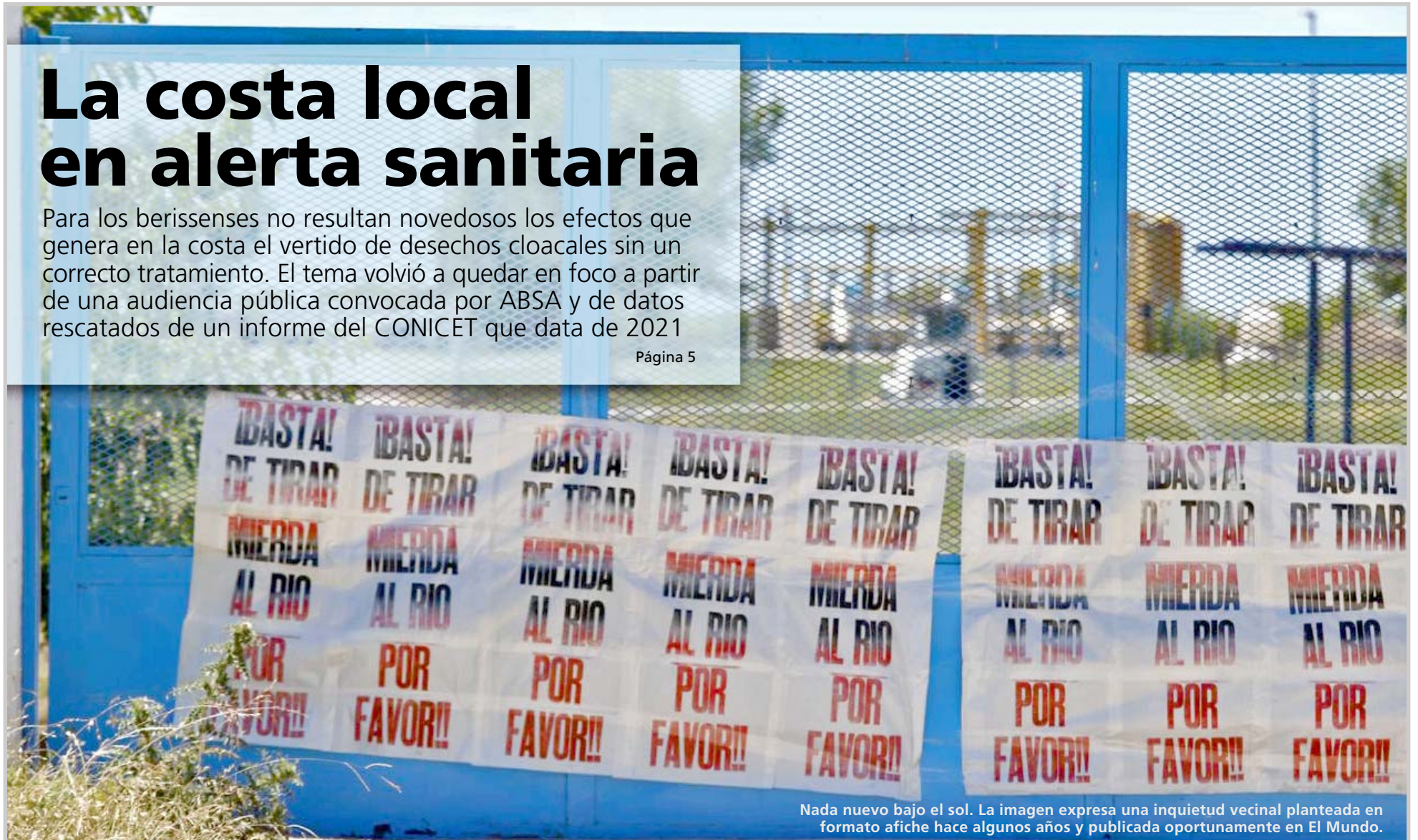
Nada nuevo bajo el sol. La imagen expresa una inquietud vecinal planteada en formato afiche hace algunos años y publicada oportunamente en El Mundo.