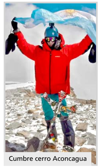
Cumbre cerro Aconcagua

Finalmente, alude a su hábito de portar la celeste y blanca a la hora de iniciar cada nuevo ascenso. "Desde que di los primeros pasos en la actividad vengo pensando y diciendo lo lindo que es nuestro país. A instancias de mi madre, incorporé esto como una forma de mostrar y valorar que esa geografía extraordinaria es nuestra", sostiene.