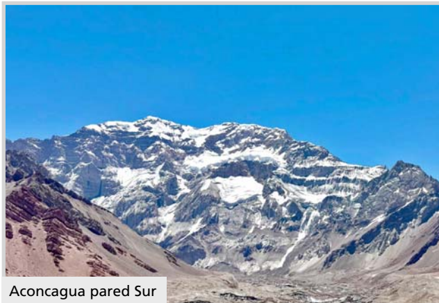
Aconcagua pared Sur

Coronando un proceso progresivo que llevó años y tras casi doce horas de ascenso en hielo y nieve desde el último campamento ubicado a 6000 metros de altura, el 14 de enero el berissense Javier Jara alcanzó el techo de América.