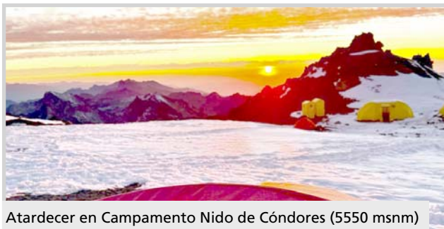
Atardecer en Campamento Nido de Cóndores (5550 msnm)

que en la altitud todo cambia: la respiración, la frecuencia cardíaca, la hidratación, el apetito. Es vital conocer cómo nos sentimos ante el 'mal de altura', también conocido como 'apunamiento', agrega, destacando que en caso del Aconcagua existen controles médicos obligatorios, a cargo de profesionales de jerarquía y con una importante experiencia en este tipo de actividad.