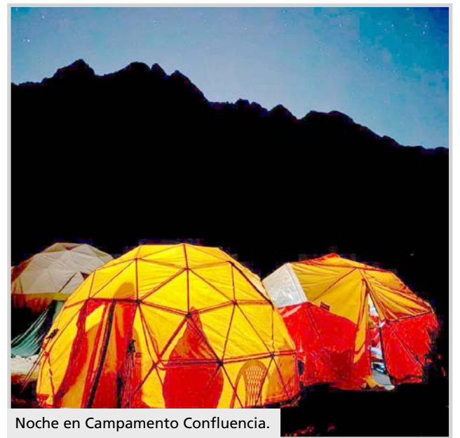
Noche en Campamento Confluencia.

El éxito en la empresa, sostiene del mismo modo, tiene en la actividad del club y los coordinadores una pieza clave. "Se van convirtiendo en artifices de lo imposible, con información precisa de los lugares y del equipamiento que muchas veces escasea o se torna costoso. Cuando empezé a armar el equipo no es fácil, pero averiguando encontré alternativas para todos los bolsillos, sin descartar lugares donde alqui-