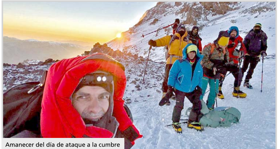
Amanecer del día de ataque a la cumbre