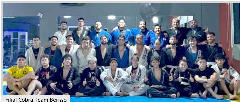
Filial Cobra Team Berisso

El Gimnasio Municipal fue escenario recientemente de la tercera edición del Open Ciudad de Berisso de la disciplina, al que asistieron en total más de cuatrocientos participantes de diferentes puntos del país. La entrada para presenciar el encuentro fue un alimento no perecedero o un ú-