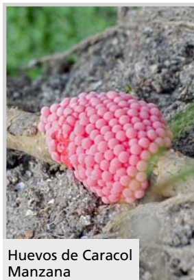
Huevos de Caracol Manzana