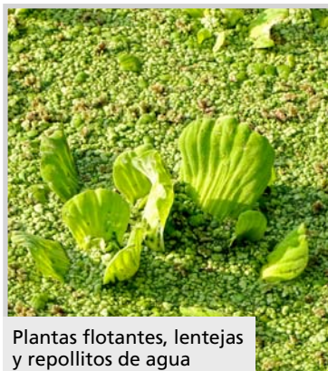
Plantas flotantes, lentejas y repollitos de agua