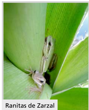
Ranitas de Zarzal