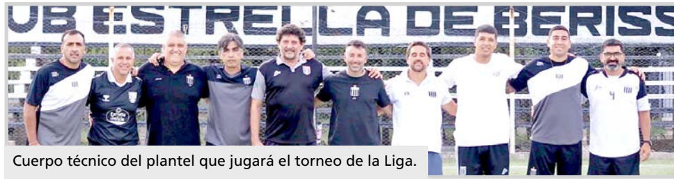
Cuerpo técnico del plantel que jugará el torneo de la Liga.