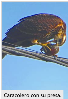
Caracolero con su presa.