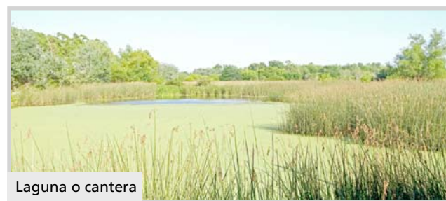
Laguna o cantera

Empecemos por el principio. Desde hace unos 6000 a 8000 años toda esta superficie berissense era agua. El Mar Querandinense se desplegaba por una gran superficie del territorio bonaerense.