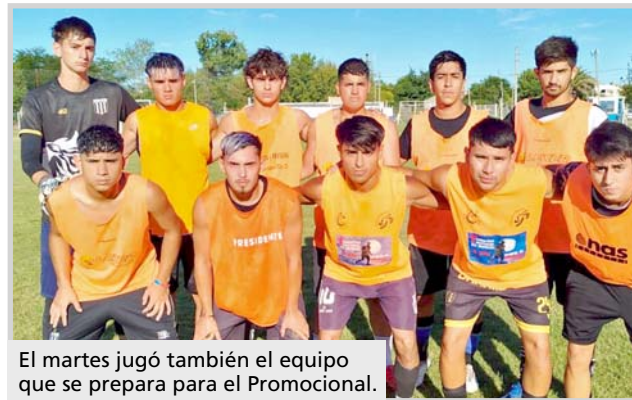
El martes jugó también el equipo que se prepara para el Promocional.