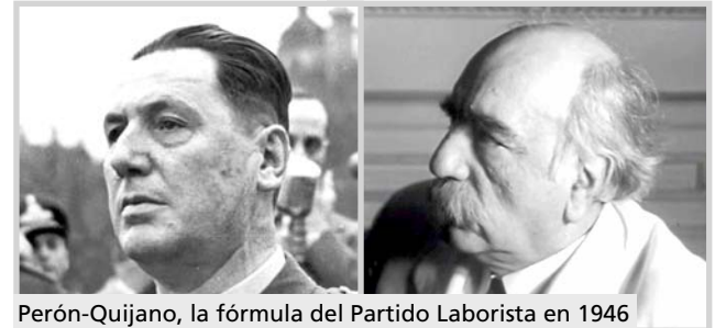
Perón-Quijano, la fórmula del Partido Laborista en 1946

Si bien en la jornada de votación los grandes medios transmitían la sensación de que la Unión Democrática marchaba hacia un seguro triunfo, el a-