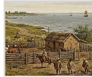
Generada con herramientas de IA, la imagen refleja cómo pudo haberse visto 'el pago de la Magdalena' hacia el inicio del siglo XVI.

Berisso careció desde su origen, de normas zonificatorias, como en general han tenido otras ciudades. Nació como un loteo, sin siquiera una plaza pública. No hubo un plan previo. Una casa, impulsó a construir otra, dándose una mano entre los vecinos y saltando zanjas e in-